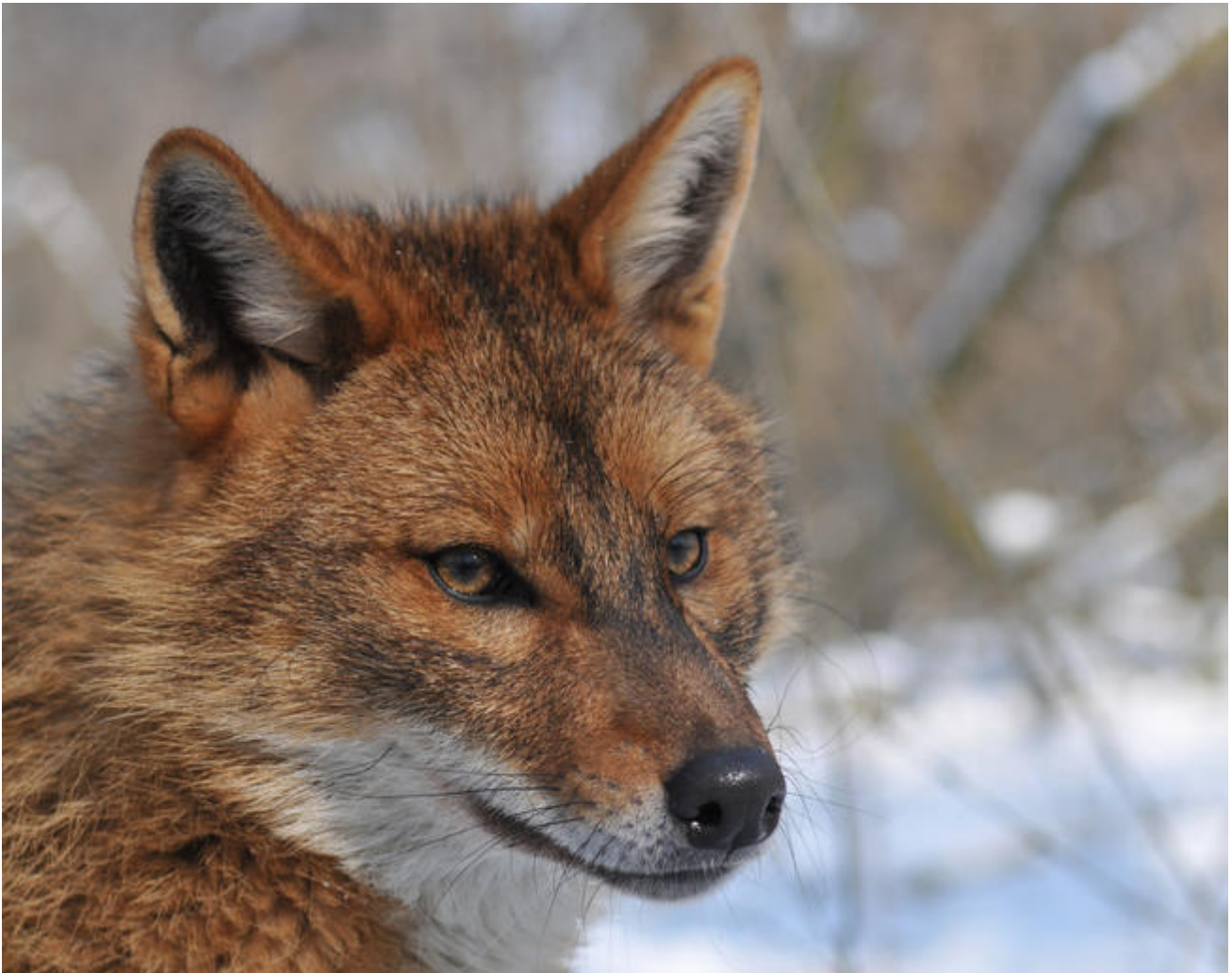
Goudjakhals Canis aureus

De goudjakhals is een middelgrote hond die zowel in paren als in roedels leeft. Vanuit het oorspronkelijke vestigingsgebied op de Balkan verspreidt het zich steeds meer naar Oostenrijk en er zijn al individuele dieren geregistreerd in Duitsland en Nederland. Samen met terugkeerders zoals de wolf en de exoot zoals de wasbeerhond, is de goudjakhals een andere nieuwkomer die van nature nieuwe gebieden koloniseert.