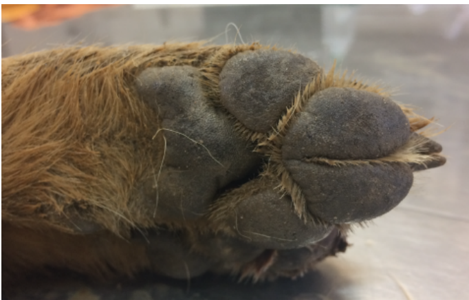
Poot Gouden Jakhals