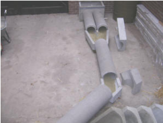
De cpl. kunstbouw met bocht uitgelegd

Worden ook prima aangenomen door de marterhond (Mecklenburg en Brandenburg). Er zijn instanties die subsidie verstrekken voor de aanleg van deze bouwen ter bestrijding van de vos. Zoals: "Inrichtingsmaatregelen project Investeringsplan weidevogels Groningen 2009"