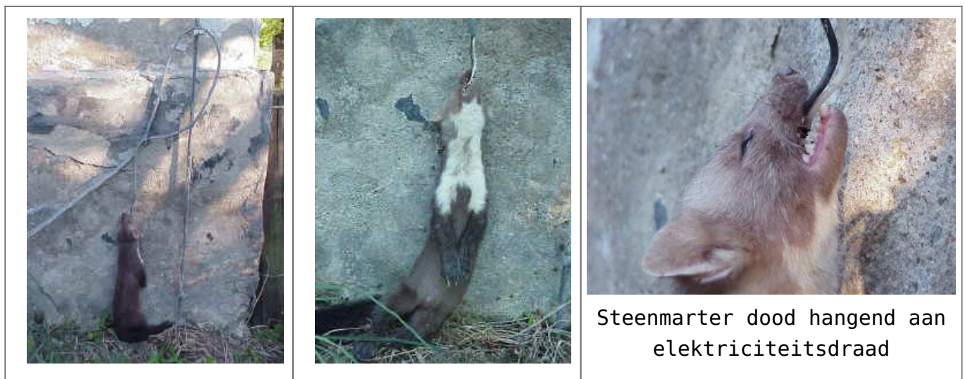
Steenarter dood hangend aan elektriciteitsdraad

men mag niet vergeten dat hier om roofdieren gaat. Beide rassen de steen- en boomarter lijken veel op elkaar, maar met wat oefening, kun je ze goed uit elkaar houden. Vooral de borstvlak helpt bij het herkennen. Bij de boomarter is hij bijna geel, en bij de steenarter helder wit. De steenarter is een dier dat de nabijheid van mensen opzoekt. Hij schrikt er niet voor terug om zich in de motorruimte van auto's, die nog een (rest) warme motor hebben, een warm plekje op te zoeken en hier aan kabels en slangen te bijten met alle gevolgen van dien. Steenmarters hebben een grote menukaart; kleine zoogdieren, vogels, reptielen maar ook steenvruchten en bessen eet hij graag.