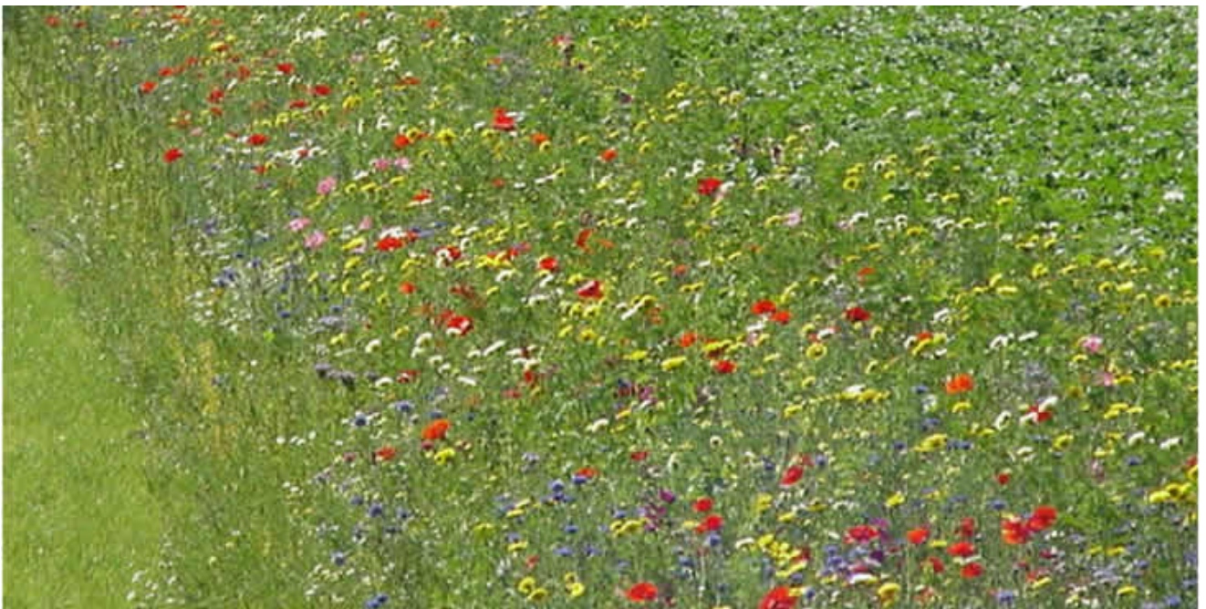
Akkerranden die niet bespoten worden met pesticiden en apart ingezaaid worden met een wildbloemenmengesel zijn een verrijking voor de flora- en fauna in de moderne akkerbouwgebieden en voor de uitstraling van de landbouw.

arig gras en kruiden zijn belangrijk, maar ook heggen en houtwallen. Deze beperken het zicht en doen daardoor de onderlinge concurrentie tussen de broedparen afnemen, hetgeen weer bevorderlijk is voor de aanwas van de stand. Patrijzen prefereren strookvormige stukken dekking, aan de randen waarvan zij zich gaarne ophouden. Ze nestelen graag in stroken